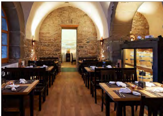
Rathaus Brauerei in Luzern schaeerholzbau: Innenausbau