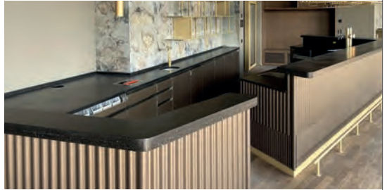
DIE NEUE GASTRO-EINRICHTUNG IM «BÄRETOWER» IN OSTERMUNDIGEN BEI BERN.